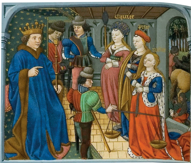
La Cité de Dieu, ©Bibliothèque du Château de Chantilly, ms. 122, f. 113v 1 ère page : Changeur ©Bibliothèque municipale de Besançon, ms. 0434, f. 272 ; Livre de comptes suivi de «Beruht» ©Bibliothèque des musées de Strasbourg, ms. 18. Clichés: IRHT-CNRS